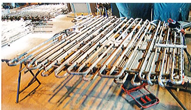
Tillverkning av ÖH-slingor