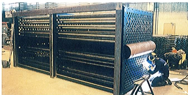
Tillverkning av luftvärmare

Oförstörande provning och kontroll utförs före leverans av ackrediterat kontrollorgan.