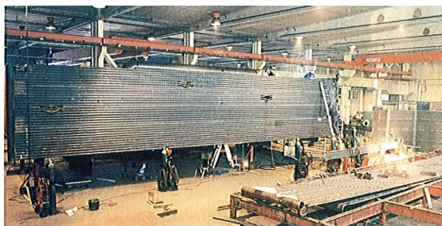
Sammansättning av panelväggar till montageenheter